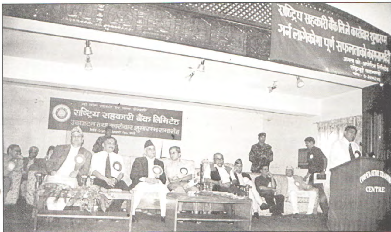
बैंक उद्घाटन कार्यक्रमको एक भलक