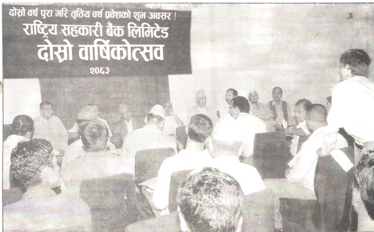
राष्ट्रिय सहकारी बैंक लिमिटेडको दोश्रो वार्षिकोत्सवको एक भलक