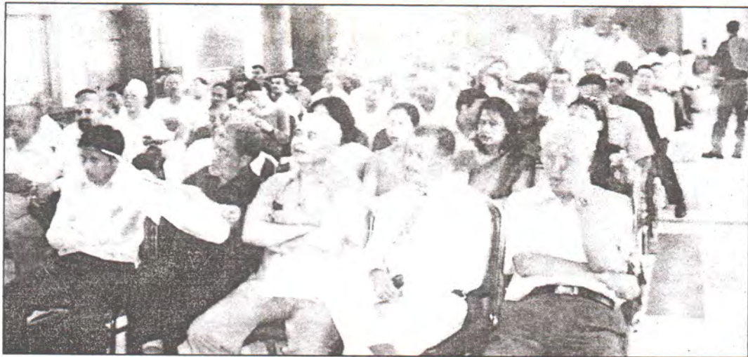
आठौं बार्षिक उत्सवमा उपस्थित सहकारीकर्मीहरु