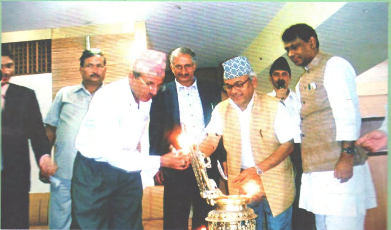
आठौँ बार्षिक उत्सवमा उद्घाटन गर्नुहुँदै कृषि तथा सहकारी मन्त्री श्री मृगेन्द्र कु. सिंह यादव